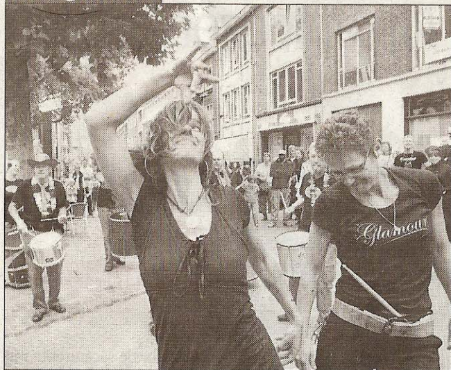
NIJMEGEN - Sambatown, dat was de bijnaam voor Nijmegen. Zondag stond het centrum vol met swingende sambadansers. Sambahuizen was het geluid, swingende lichamen de taal van de mensen. Er werd gedanst, Nijmegen was in de ban van de Samba.